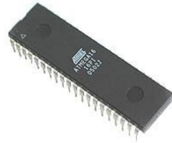
Gambar 1 IC Atmega 16

Salah satu mikrokontroler yang banyak digunakan saat ini yaitu mikrokontroler (Alf and Vegards RISC processor) AVR. AVR adalah mikrokontroler (Reduce Instruction Set Compute) RISC 8 bit berdasarkan arsitektur harvard. Secara umum mikrokontroler AVR dapat dikelompokkan menjadi 3 kelompok, yaitu keluarga AT90Sxx, Atmega, dan ATtiny pada dasarnya yang membedakan masing-masing kelas adalah memori, peripheral, dan fiturnya.