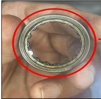
Gambar 9 Ball Bearing 2-1/2