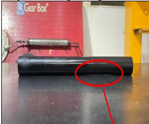
Gambar 7 N1 Shaft

N1 shaft dapat mengalami un-alignment (ketidaksejajaran) akibat hard landing. Ketidaksejajaran ini menyebabkan beban yang tidak seimbang saat engine beroperasi, meningkatkan getaran.