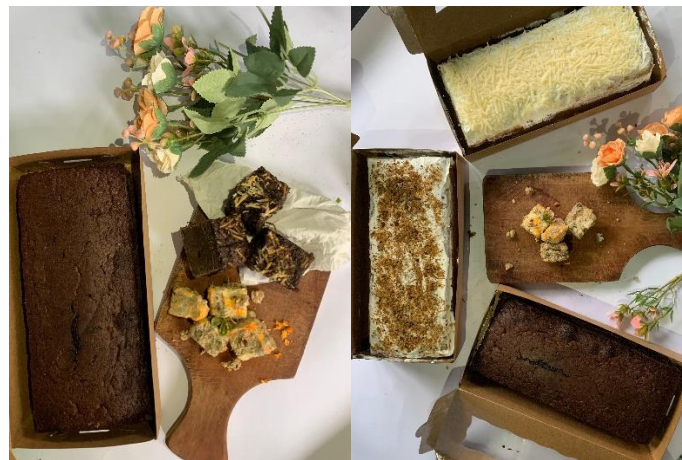
Gambar 2. Brownies Oncom Packaging Besar