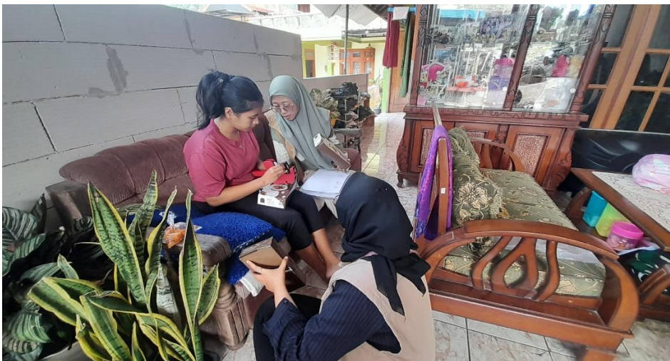
Gambar 8. Diskusi bersama pihak UMKM OVOP Mengenai Packaging Brownies Baru