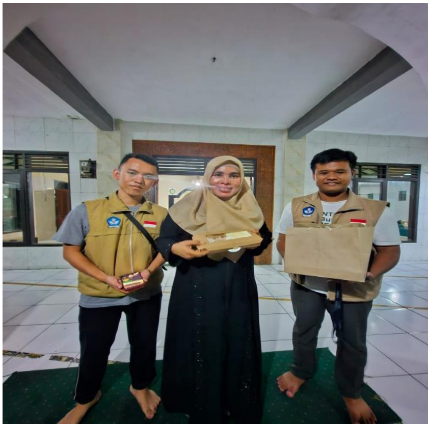
Gambar 4. Pemberian Brownies Hasil UMKM OVOP Kepada Ibu Kecamatan Sumedang Selatan