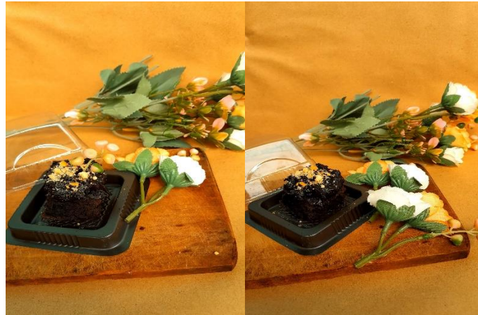
Gambar 3. Brownies Oncom Packaging Mini