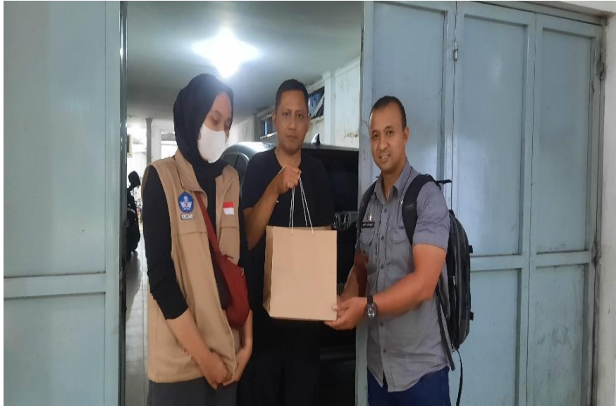
Gambar 5. Pemberian Brownies Hasil UMKM OVOP Kepada PJ Bupati Sumedang