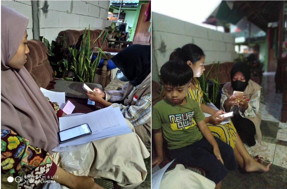
Gambar 7. Membuat dan Mendaftarkan Akun Untuk Berjualan Di Platform Jualan Online