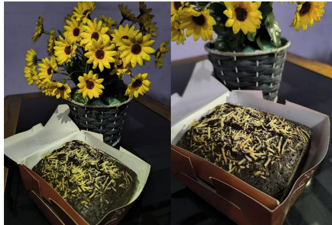
Gambar 1. Brownies Oncom Packaging Sedang