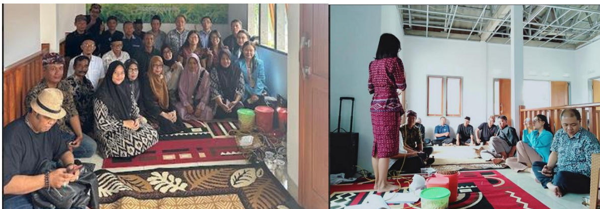
Gambar 6 Dan 7 Pelatihan Keuangan Dasar Dan Pemasaran Digital, Serta Foto Bersama Dengan Peserta

Pada materi kedua diberikan pelatihan pemasaran digital (Digital Marketing). Pelatihan ini diberikan menindak lanjuti permintaan peserta yang mengeluh karena mereka kalah bersaing dengan UMKM yang menggunakan pemasaran digital, sementara mereka masih menggunakan pemasaran konvensional. Pada akhir acara peserta banyak yang menginginkan untuk diberikan pemahaman soal pembuatan titik lokasi usaha pada google map, yang pada saat itu pula bisa langsung ditindak lanjuti karena peserta masing-masing sudah pada memiliki smart phone.