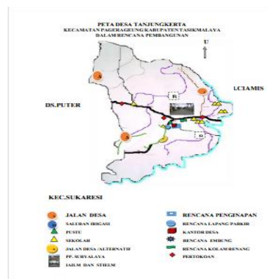
Gambar 2 Lokasi Mitra Sasaran

Tanjungkerta merupakan sebuah desa yang berada di wilayah Kecamatan Pagerageung, Kabupaten Tasikmalaya. Desa ini merupakan wilayah paling Utara Kabupaten Tasikmalaya yangberbatasan langsung dengan Desa Sindang Herang Kecamatan Panumbangan Kabupaten Ciamis. Padakegiatan Pengabdian ini yang menjadi mitra sasaran adalah para ibu-ibu PKK di Desa Tanjungkerta dan anggota Koperasi Produsen Satujuan 171.