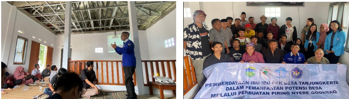
Gambar 2 Dan 3, Foto Sosialisasi Kewirausahaan, Dan Foto Bersama Dengan Peserta

Alasan pemberian Materi Pertama adalah banyak sekali masyarakat di Desa Tanjungkerta yang tidak memiliki penghasilan lain selain menjadi petani penggarap, padahal potensi yang dimiliki oleh daerah tersebut banyak sekali yang belum termanfaatkan. Sementara pemberian Materi Kedua adalah permintaan dari Pemerintah Daerah Kabupaten Tasikmalaya Cq Dinas Pemberdayaan Masyarakat Desa untuk menselaraskan kegiatan usaha di wilayah Tasikmalaya disesuaikan dengan Budaya Lokal atau Kearifan Lokal yang dimiliki sehingga mampu meningkatkan tingkat produksi karena memiliki keunikan tersendiri dan sekaligus mempromosikan budaya yang ada di Tasikmalaya sehingga mampu mendorong sektor pariwisata melalui kegiatan UMKM.