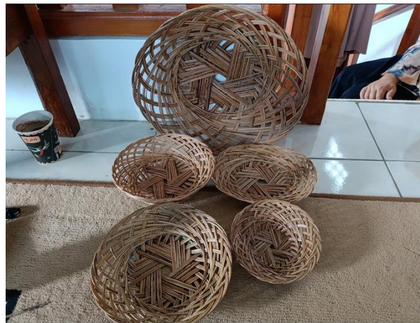
Gambar 10 : Hasil Karya Peserta Pelatihan Pada Hari Itu Juga

Program kegiatan Pengabdian kepada Masyarakat di Desa Tanjungkerta Kecamatan Pagerageung Kabupaten Tasikmalaya secara keseluruhan dapat terealisasi dengan baik sesuai dengan jadwal kegiatan, meskipun masih terdapat beberapa kekurangan-kekurangan dalam pelaksanaan kegiatan. Keberhasilan pelaksanaan program ini tidak lepas dari bantuan kepala desa, perangkat desa serta partisipasi masyarakat Desa Tanjungkerta dimana harapan peserta Pengabdian (PKM) tentunya melalui program ini dapat menumbuhkan lagi semangat berwirausaha masyarakat. Namun, dikarenakan waktu PKM yang sangat terbatas menghambat peserta PKM turun ke lapangan untuk melihat kondisi pembuatan kerajinan berbahan dasar nyere serta program sosialisasi dan pelatihan dalam usaha membangkitkan semangat wirausaha masyarakat khususnya dalam pembuatan piring nyere Godebag.