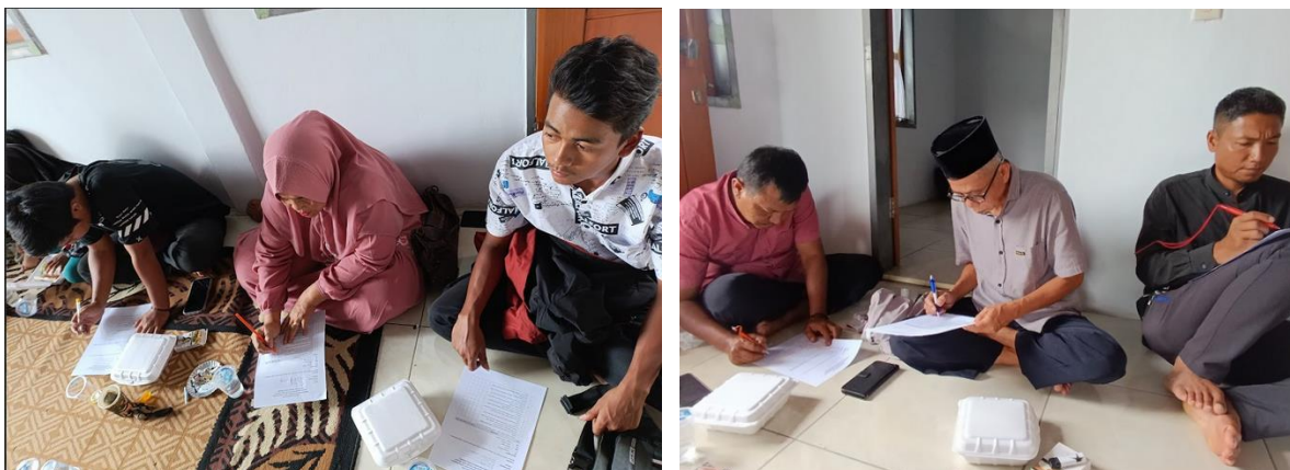
Gambar 8 Dan 9 : Foto Pelaksanaan Pre Test, Dan Past Test Kegiatan Pkm

Kegiatan Pengabdian kepada masyarakat ini diikuti sekitar 50 orang peserta yang terdiri dari Ibu-Ibu PKK dan Masyarakat Desa Tanjungkerta, baik sebagai pelaku UMKM maupun yang belum memiliki kegiatan usaha ataupun yang berminat membuka usaha baru, serta Anggota Koperasi Produsen Satujuan 171 Desa Tanjungkerta Kecamatan Pagerageung Kabupaten Tasikmalaya yang tergabung dalam wadah Paguyuban UMKM Satujuan Tasikmalaya. Hasil dari pelaksanaan PKM adalah masyarakat semakin mengerti tentang bagaimana memanfaatkan potensi daerah untuk meningkatkan kesejahteraan masyarakat melalui wirausaha serta permasalahan yang dihadapi wirausaha serta kemampuan peserta mengatasi permasalahan tersebut.. Hal ini dibuktikan dengan hasil pretest dan posttest yang dilakukan terhadap mereka. Hasil Pre Test dan Post Test diolah menggunakan alat uji Wilcoxon. Berdasarkan hasil uji beda (Uji Wilcoxon) menunjukkan ada perbedaan pada saat pre dan post, terlihat dari hasil signifikan 0,001 < 0,05 . Dengan demikian pembekalan UMKM terhadap masyarakat sangat bermanfaat sekali dan menambah pengetahuan dan keterampilan para pelaku peserta PKM di Desa Tanjungkerta Kecamatan Pagerageung Kabupaten Tasikmalaya.